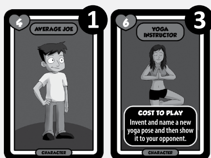
Emmas sida av slagfältet.

STRATEGITIPS: Försök att aldrig få slut på kort, så vida det inte är den sista omgången, eller en omgång som du känner att du MÅSTE vinna. Var inte rädd för att ibland passa även om din motspelares karaktärer har högre sex appeal än dina. Du kommer förlora omgången, men det betyder även att du får det värdefulla startspelarkortet, och vara den som börjar nästa runda.